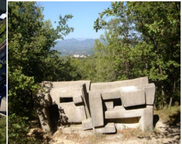
Parvine CURIE, L'Echo de la forêt, 1977